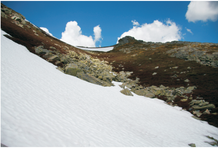
Neveiros entre pena Negra e Trevinca.