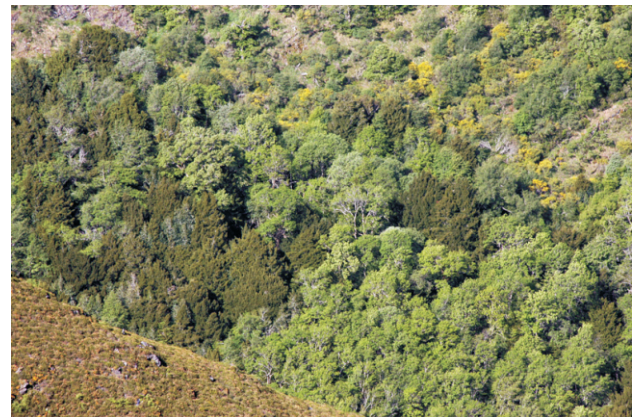
Detalle do teixidal desde o Lombo da Cabrita.