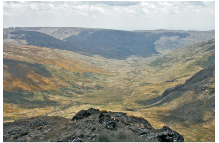
Val glaciar polo que discorre o río Tera, desde o cumo de Trevinca