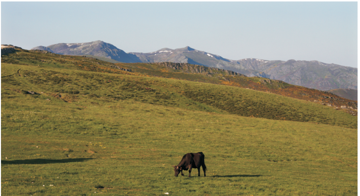
Vista desde o camiño de Fonte da Cova. Á esquerda Pena Surbia e á dereita Pena Negra. Entre elas, máis atrás, Pena Trevinca.