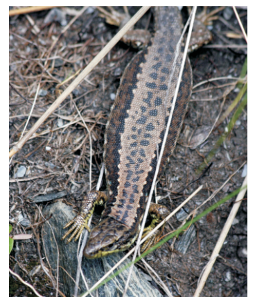
Femia de lagarta rabuda ( Iberolacerta galani ), un endemismo do Macizo de Trevinca recentemente descrito.

Desde Casaio cóllese a estrada á Baña, e xusto na fronteira con Castela-León atópase o refuxio de Fonte da Cova, desde o que parte a ruta. A primeira parte vai por unha pista de terra ata as Louseiras e pódese facer en coche. Logo séguese a pé. Desde o alto da Cabrita sae a ruta que vai ao Teixidal.