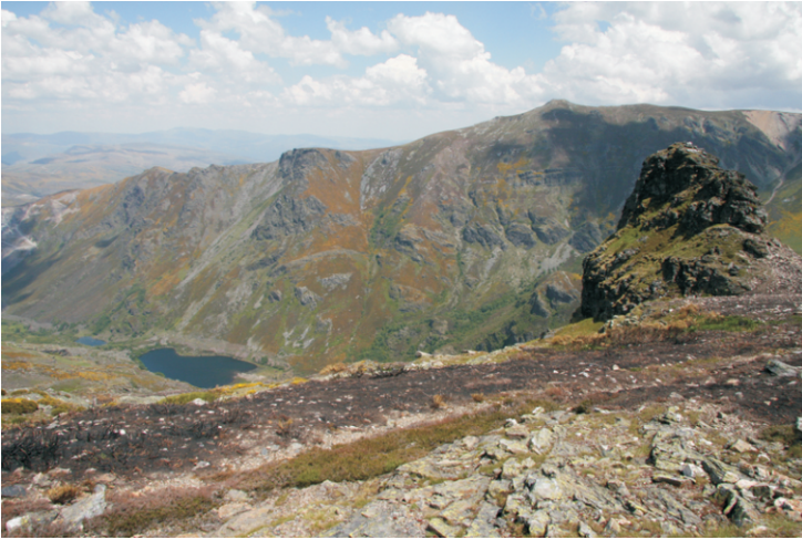
Lagoas da Baña e O Picón.