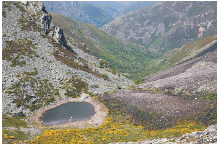
Lagoa da Serpe nas nacentes do rego de San Xil.